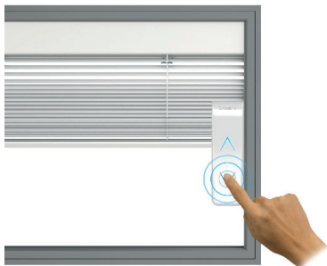
Discesa / Lowering