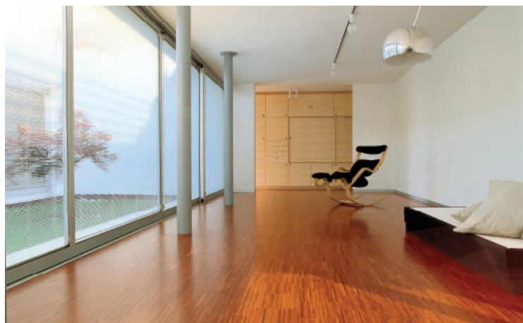
Residenza privata / Private house Tende ScreenLine su grandi serramenti scorrevoli ScreenLine blind systems on large sliding windows