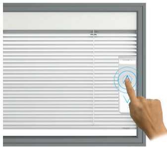
Salita / Raising