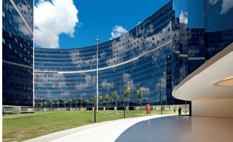
Cidade Administrativa Minas Gerais - Brazil 22,000 tende in vetrocamera ScreenLine 22,000 ScreenLine integrated blind systems