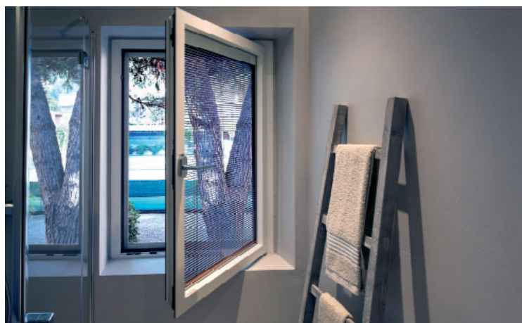
Residenza privata / Private house Tenda motorizzata ScreenLine su finestra ad un'anta ScreenLine motorised blind on casement window